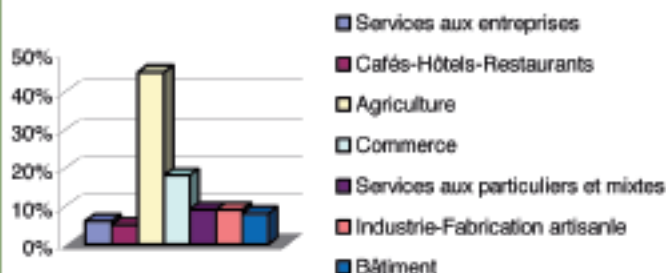
Répartition des entrepreneurs corréziens de 55 ans et plus par secteurs d'activités

Les entrepreneurs de Corrèze de 55 ans ou plus exercent en premier lieu dans l'agriculture (45%), ensuite dans les activités commerciales (18%), les activités de services (15%), la production artisanale ou industrielle (9%), le bâtiment (8%), enfin dans le secteur des Cafés Hôtels Restaurants (5%).